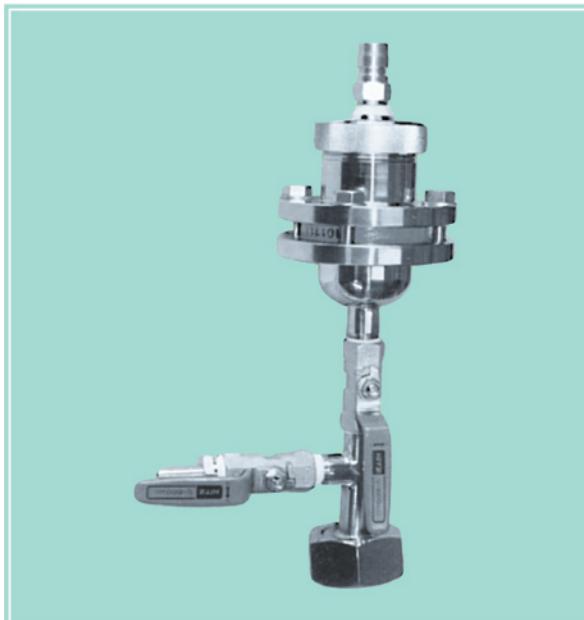
各種タンク取付部品一例 (小型タンク用ベントフィルター)