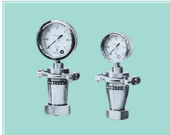
ダイヤフラム圧力計 (ジョイントセット方式)