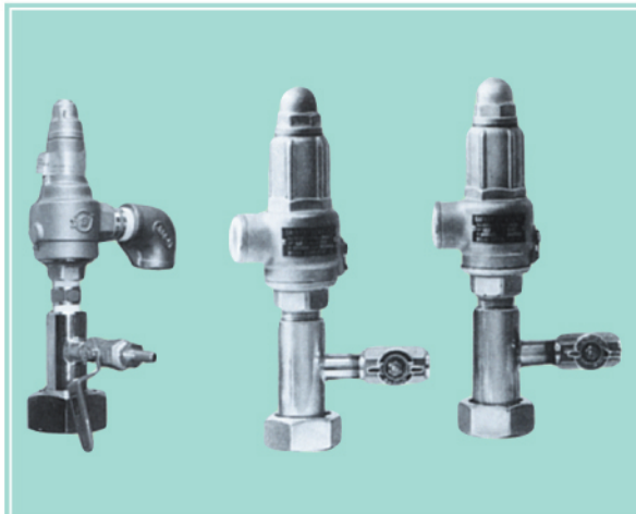
安全弁 (特殊ジョイント方式)